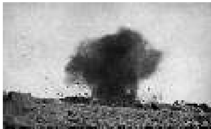
Đạn pháo của Đức nổ ở gần phòng tuyến của Anh.